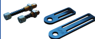
Fjäderben & Fästen