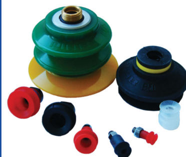
Sugkoppar PIAB & OEM