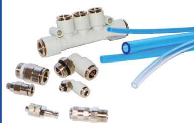
Kopplingar & Slangar